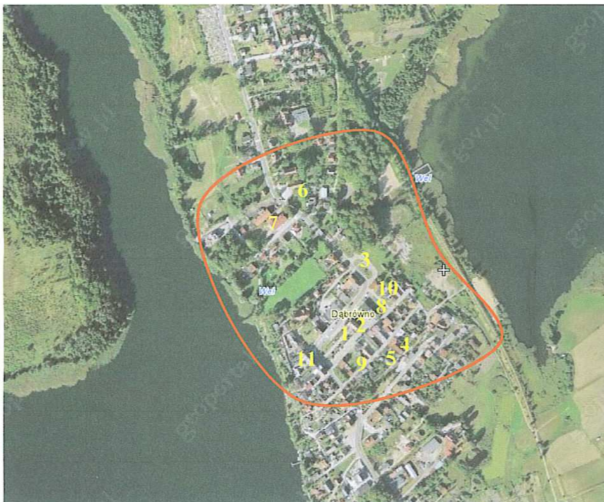
Rysunek 1 Obszary o szczególnym znaczeniu dla zaspokojenia potrzeb mieszkańców

W przestrzenno – urbanistycznym układzie wsi można wyróżnić centralną część miejscowości Dąbrówno. Znajduje się tu większość najważniejszych instytucji społecznych i publicznych na terenie Dąbrówna. Są to: Szkoła Podstawowa Rynek, Urząd Gminy, przystanek autobusowy, Gminny Ośrodek Kultury, Ośrodek zdrowia, Poczta, Apteka, Gminna Biblioteka Publiczna, Ochotnicza Straż Pożarna, plac zabaw, Kościół pw. św. Jana Nepomucena i Niepokalanego Poczęcia Najświętszej Maryi Panny w Dąbrównie. W niewielkiej odległości znajdują się również: Komisariat Policji, boisko sportowe, cmentarz.