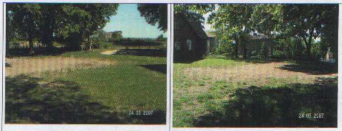
Miejsce, w którym ma powstać ogródek jordanowski dla dzieci

Innym niezwykle ważnym przedsięwzięciem, które pozytywnie wpłynie na atrakcyjność mieszkalną oraz turystyczną Lewańdu Wielkiego jest utworzenie ogródka jordanowskiego. Przy dawnym budynku Szkoły Podstawowej w Lewańdzie Wielkim jest plac przeznaczony na ten cel. Znajduje się tam obecnie jedna huśtawka. Marzeniem wszystkich jest stworzenie profesjonalnego placu zabaw dla dzieci, wyposażonego w bezpieczne urządzenia sportowo-rekreacyjne służących najmłodszym mieszkańcom. Zadanie to jest niezwykle ważne z uwagi fakt, iż na terenie całej gminy Dąbrówno nie ma przedszkola dla dzieci.