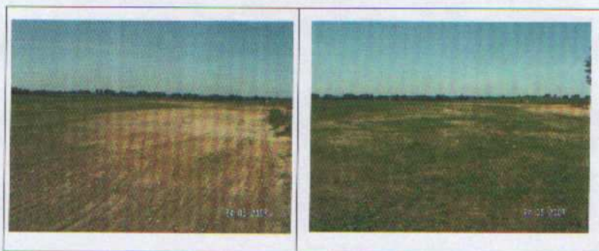
Teren przygotowywany na boisko sportowe

Dla dzieci i młodzieży, która stanowi ponad 30% mieszkańców sami – na działce gminnej – wyrównali i uprzątnęli teren przeznaczony na boisko sportowe. Jest on usytuowany w bezpiecznej odległości od biegnącej przez miejscowość drogi powiatowej. Niestety z powodu ograniczeń finansowych boisko nie jest ogrodzone, nie ma jeszcze również bramek do gry w piłkę nożną. Jednak teren już dziś cieszy się ogromnym zainteresowaniem dzieci i młodzieży.