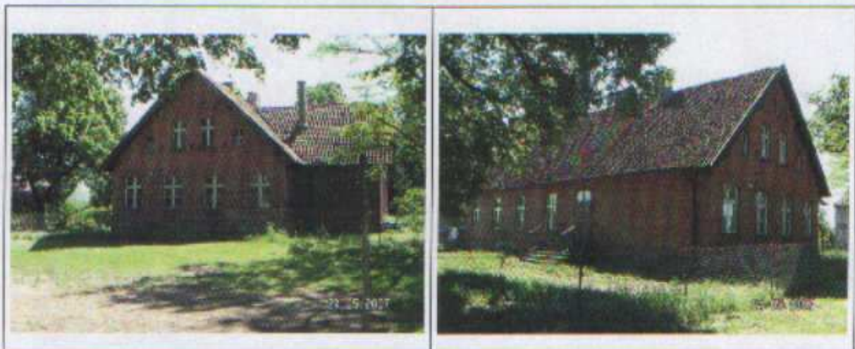
Budynek po byłej Szkole Podstawowej

Dawniej we wsi funkcjonowało Kółko Rolnicze, a istniejąca tu szkoła podstawowa skupiała wszelkie inicjatywy dziecięce, młodzieżowe oraz dorosłych mieszkańców. W 1999 roku szkoła w Lewałdzie Wielkim została zamknięta. W budynku szkoły są obecnie mieszkania prywatne.