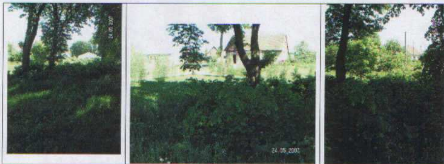
Miejsce, w którym ma powstać park

Innym niezwykle ważnym przedsięwzięciem, które pozytywnie wpłynie na atrakcyjność mieszkalną oraz turystyczną Lewańdu Wielkiego jest utworzenie ogródka jordanowskiego. Przy dawnym budynku Szkoły Podstawowej w Lewańdzie Wielkim jest plac przeznaczony na ten cel. Znajduje się tam obecnie jedna huśtawka. Marzeniem wszystkich jest stworzenie profesjonalnego placu zabaw dla dzieci, wyposażonego w bezpieczne urządzenia sportowo-rekreacyjne służących najmłodszym mieszkańcom. Zadanie to jest niezwykle ważne z uwagi fakt, iż na terenie całej gminy Dąbrówno nie ma przedszkola dla dzieci.