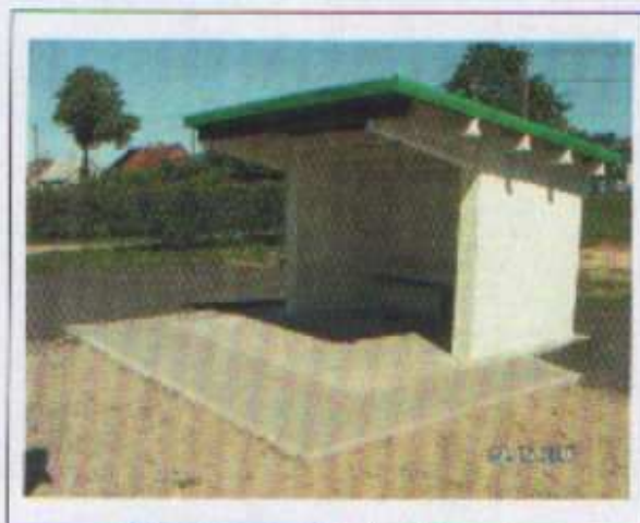
Odnowiony przystanek autobusowy

Kolejny przedsięwzięciem mieszkańców Lewańdu Wielkiego było odnowienie przystanku autobusowego. Wykonano nową elewację przystanku oraz ułożono wokół polbruk.