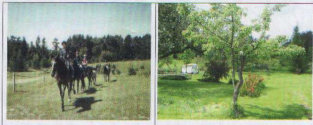
Gospodarstwo agroturystyczne „Lajkonik”

W miejscowości przeważają budynki jednorodzinne, część z nich jest jeszcze z okresu przedwojennego. We wsi są trzy bloki, a w każdym z nich mieszkają cztery rodziny.