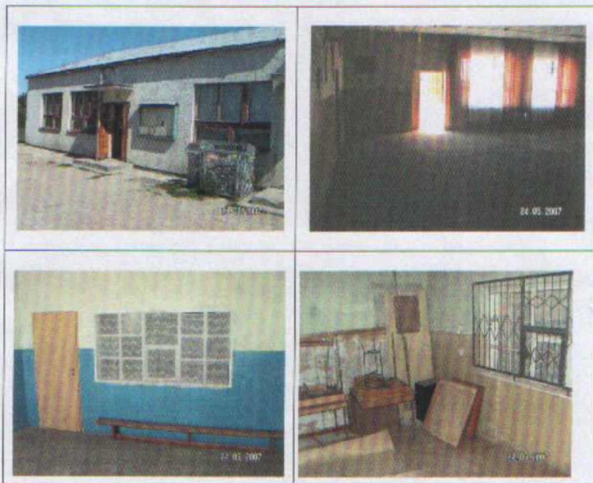
Budynek świetlicy wiejskiej

Aby świetlica mogła pełnić swoje funkcje nadal konieczny jest remont budynku oraz zakup odpowiedniego wyposażenia. Umożliwi to zorganizowanie wielu inicjatyw społecznych, jak np. kursy i szkolenia dla mieszkańców, czy zajęcia pozalekcyjne dla dzieci.