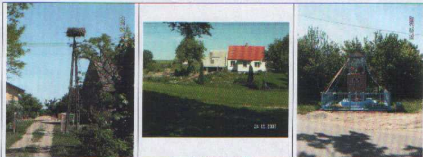
Lewańd Wielki – wygląd wsi

Uroku wsi dodają drzewa rosnące wzdłuż drogi powiatowej przebiegającej przez całą miejscowość oraz bocianie gniazda.