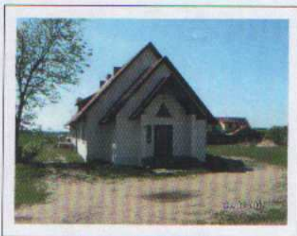
Kaplica w Lewańdzie Wielkim

W 1993 roku mieszkańcy Lewańdu Wielkiego wspólnie własnymi siłami wybudowali kaplicę, w której odbywają się niedzielne oraz świąteczne nabożeństwa.