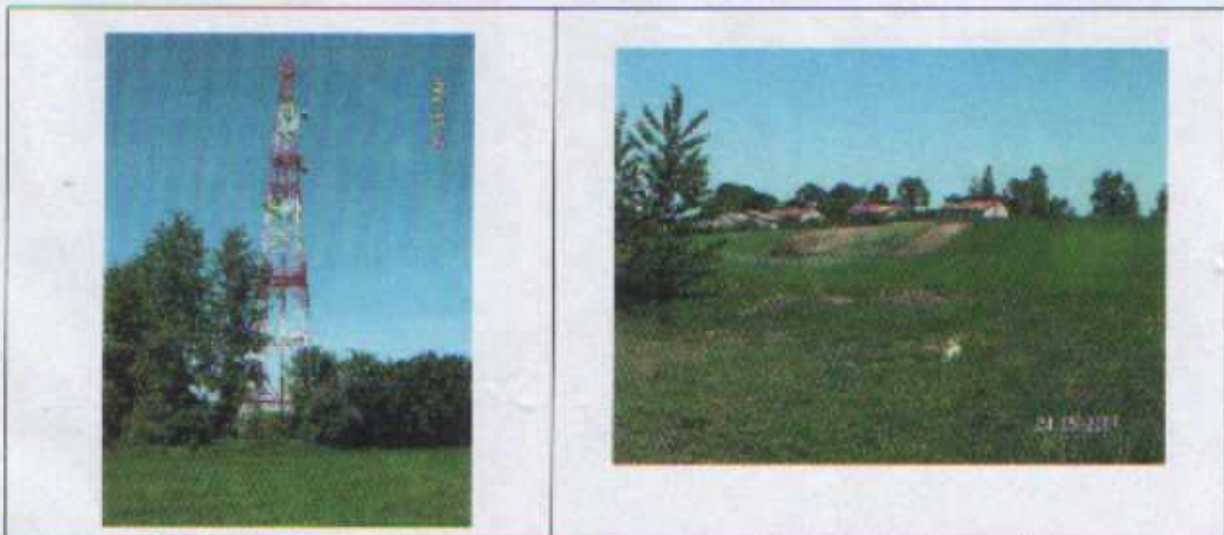
Wieża telefonii cyfrowej