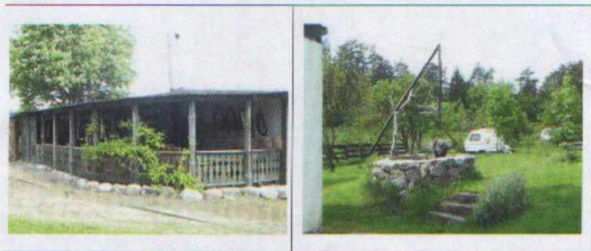
Gospodarstwo agroturystyczne „Lajkonik”