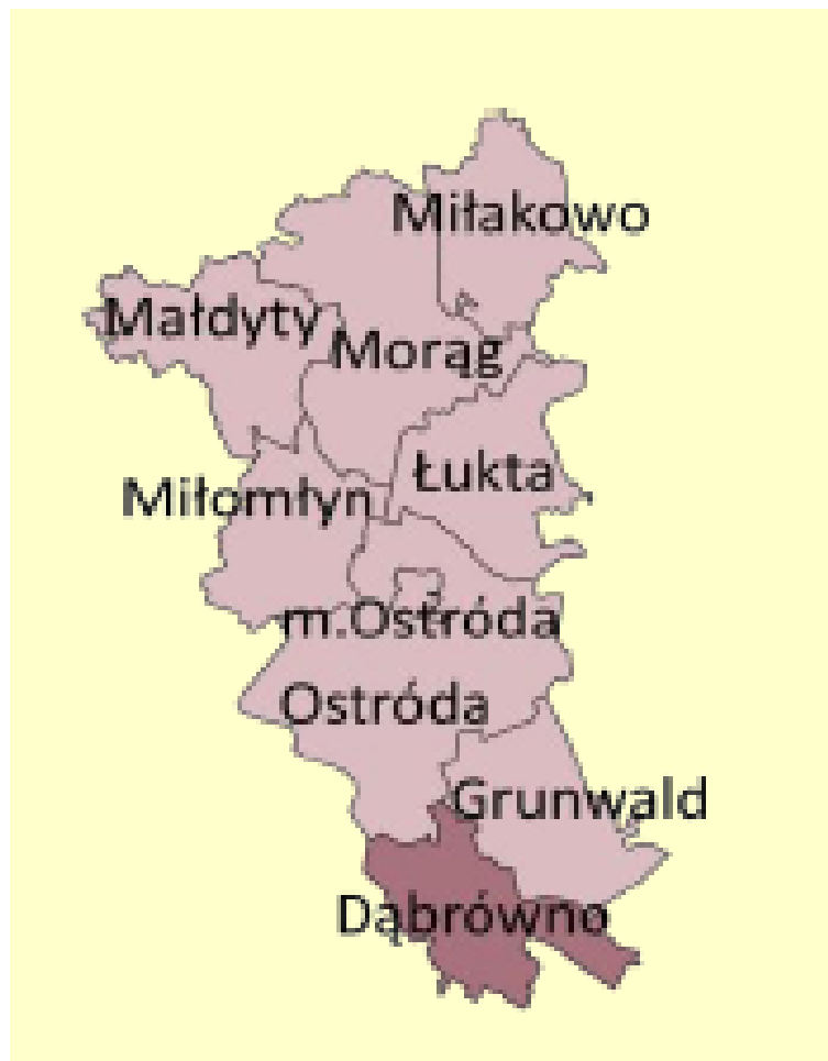
Rys. 1. Położenie Gminy Dąbrówno w powiecie ostródzkim

Do najważniejszych szlaków komunikacyjnych na terenie gminy należą drogi wojewódzkie nr 537 Lubawa –Pawłowo oraz nr 542 Rychnowo - Działdowo.