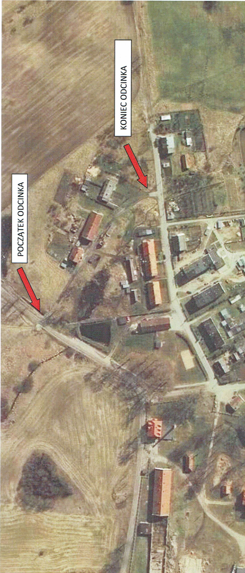
DROGA GMINNA W MIEJSCOWOŚCI WIERZBICA – LOKALIZACJA SZCZEGÓŁOWA